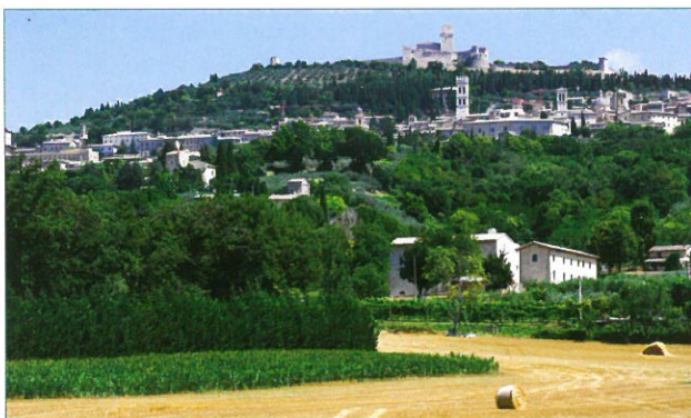
Vue du complexe de San Masseo

Le complexe, central par rapport au cadre naturel qui l'entoure, est situé aux pieds du relief sur lequel s'élève la ville, lequel peut lui-même être vu comme assis en rapport au Mont Subasio. Établi entre Saint-Damien, la Portioncule et Sainte-Claire, le monastère de San Masseo se trouve le long de la via Petrosa, qui montait des champs de la vallée de Spoleto jusqu'à la Porte Mojano, en quittant la via Francesca. Au centre d'un bassin hydrographique qui forme une sorte d'amphithéâtre naturel, placé sur l'axe médian de la ville et limité par les deux fossés, celui de Mojano et celui de Santureggio, le prieuré de San Masseo recouvrit de sa structure agricole un drainage romain, perfectionnant la technique d'irrigation et le rendement des vastes terrains fonciers, des ateliers et des moulins dont il disposait.