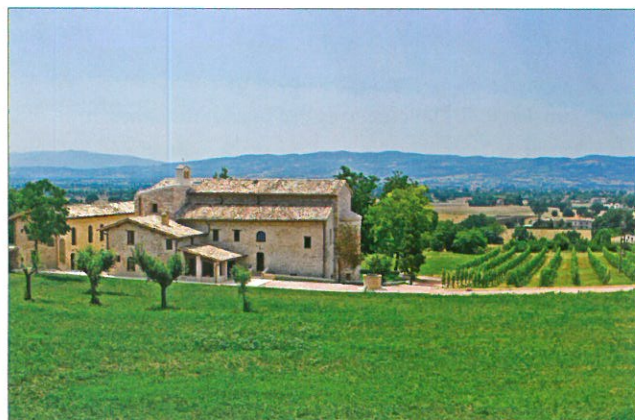
Vue du complexe de San Masseo

Des journées de retraite individuelle et de révision de vie en tout temps de l'année, avec un membre de la communauté (écrire ou téléphoner pour se mettre d'accord à l'avance).