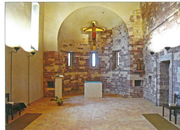
Église de San Masseo

On considérait récemment encore que seule la crypte romane subsistait de l'ancienne église bénédictine du XI e siècle. Mais la nef et le sanctuaire sont en réalité conservés, comme cela ressort de la restauration actuelle, menée de concert avec la Direction régionale et la Surintendance aux biens architecturaux et paysagers d'Ombrie. L'église existe donc encore, avec tous les signes de son temps. Cette église est consacrée à saint Matthieu l'Évangéliste , et son nom, qui remonte à une matrice byzantine, aurait été transformé en San Masseo dans le dialecte local.