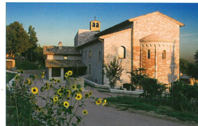
San Masseo est situé à mi-hauteur de la colline d'Assise entre Sainte-Claire, Saint-Damien et la Portioncule.