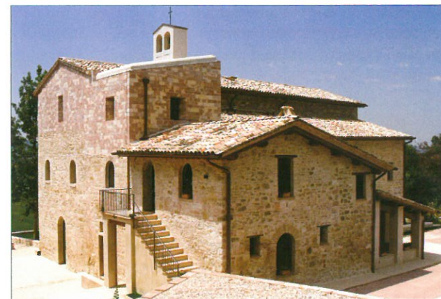
Vue de l'édifice principal de San Masseo – côté nord-est

On pense, traditionnellement, que la localité de San Masseo était le premier refuge où l'on abritait les cas suspectés de lèpre (voir l'épisode du baiser de saint François au lépreux). San Masseo aurait été pour saint François un lieu de halte et de prière : certains voudraient même y voir la crypte où, selon Thomas de Celano, François Patrem in abscondito exorabat et où il latitavit . Mais auparavant déjà, en mai 1130, l'église de San Masseo est cédée, avec tous ses biens, à l'abbaye de la Sainte-Croix de Sassovivo, dont elle représente un centre commercial et de subsistance fondamental, et sous la juridiction de laquelle elle demeure jusqu'en 1503, lorsque le prieuré de San Masseo est incorporé aux biens de l'abbaye de Saint-Pierre d'Assise.