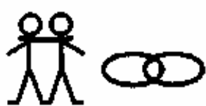
pour faire alliance avec Jésus