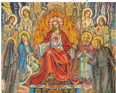
Mosaïque du Sacré-Cœur, chapelle Saint-Claude-la-Colombière, Paray-le-Monial.