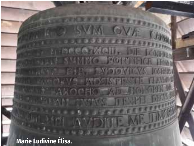
Marie Ludivine Élisa.