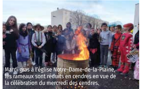
Mardi gras à l'église Notre-Dame-de-la-Plaine, les rameaux sont réduits en cendres en vue de la célébration du mercredi des cendres.