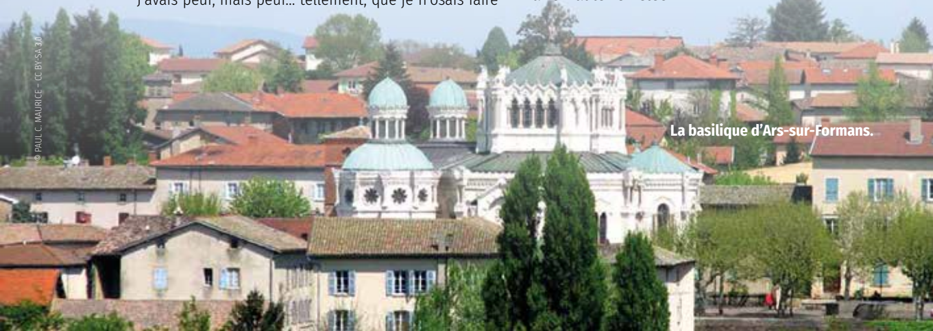
La basilique d'Ars-sur-Formans.