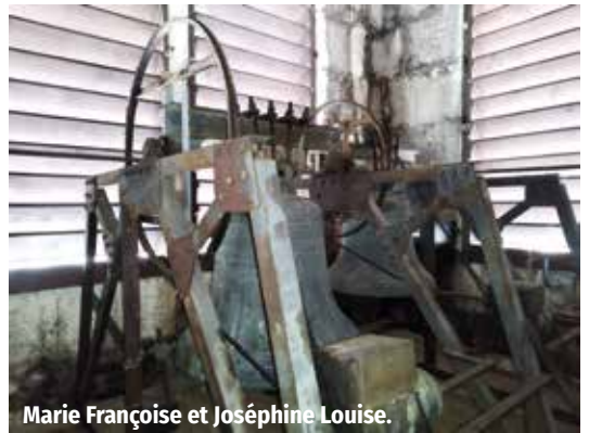
Marie Françoise et Joséphine Louise.

Selon la tradition, elles partiront prochainement à Rome le Jeudi saint et reviendront pour Pâques comme chaque année. On les entend chaque jour sans les voir, et elles annoncent baptêmes, mariages, funérailles, fêtes, et messes dominicales. Comme elles le disent si bien, elles chantent la gloire du Seigneur. Vous les aurez reconnues, il s'agit des 3 cloches de l'église Saint-Léger. Des curieux m'ont posé des questions sur leurs identités, alors je suis monté au clocher et j'ai recopié simplement ce qu'elles nous disent d'elles-mêmes. « C'est comme le port-salut, c'est écrit dessus. » Je vous retranscris donc le message tel quel, j'ai juste rajouté la traduction pour les parties latines. Il n'y a qu'une seule chose que je n'ai pas pu retrouver, c'est leur poids respectif. Peut-être que certains d'entre vous pourraient le retrouver dans les archives. Je lance ce défi pour les plus curieux.