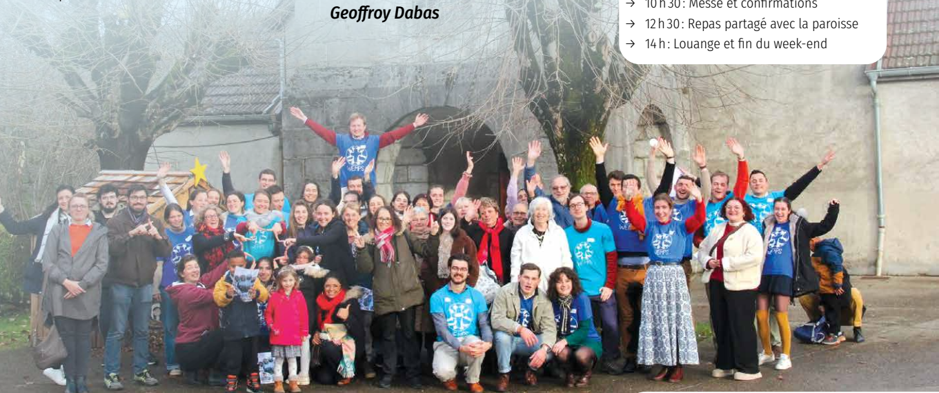
Devant l'église Saint-Martin de Dortan avec les wemps l'automne dernier.