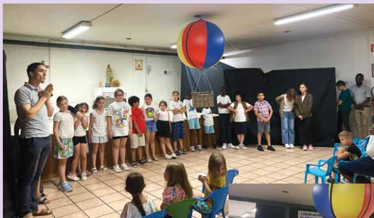
Le spectacle « Carlo Acutis ».