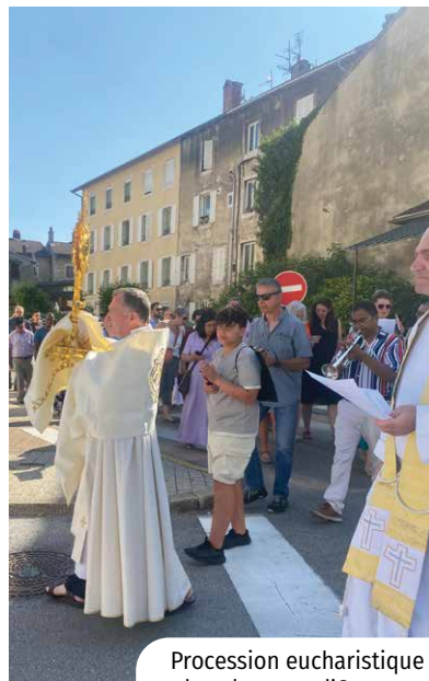
Procession eucharistique dans les rues d'Oyonnax