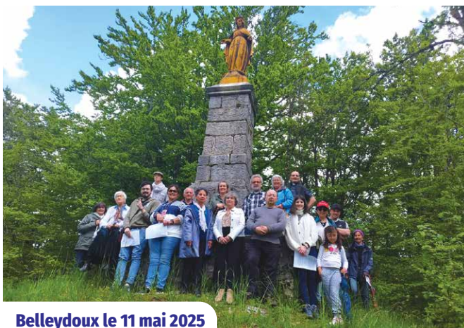
Belleydoux le 11 mai 2025

Malgré un ciel menaçant, environ 25 personnes se sont mises en route, très confiantes, depuis la chapelle Sainte-Anne, pour monter auprès de la Vierge de Gobet.