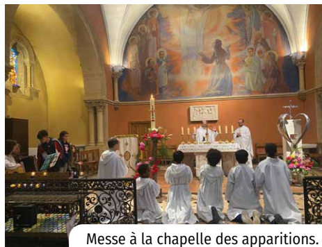
Messe à la chapelle des apparitions.