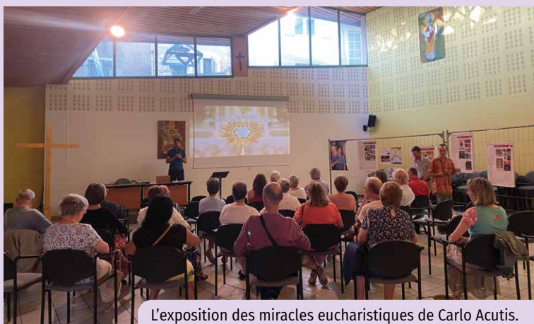
L'exposition des miracles eucharistiques de Carlo Acutis.