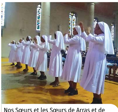
Nos Sœurs et les Sœurs de Arras et de Villeurbanne dansent en action de grâce (dimanche 14 septembre).

Les instituts séculiers sont des instituts de vie consacrée reconnus dans l'Église catholique depuis 1947. En France, 3000 personnes environ, hommes ou femmes, célibataires ou veufs, sont membres d'une trentaine d'instituts séculiers. Ils vivent dans le monde, gardant leur profession, et ont pour mission d'y être présents, à la manière du sel ou du ferment, pour y faire progresser l'esprit de l'Évangile. Ils s'engagent définitivement à ce genre de vie par des vœux après plusieurs années de formation.