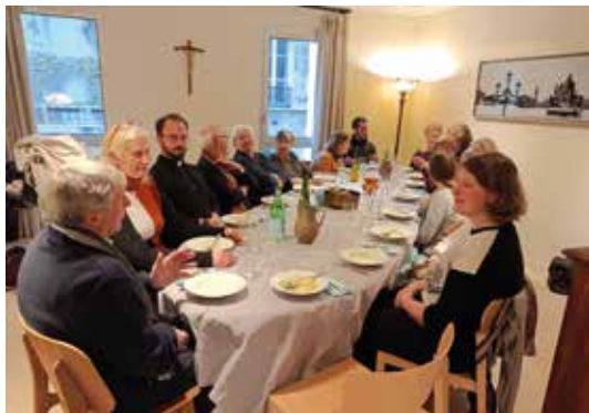
Une partie de l'équipe « Pasteur selon mon Cœur » accueillie à Paris.

du nombre de pratiquants dominicaux; et de l'autre, une augmentation importante du nombre d'adultes demandant un sacrement. Tout cela n'est pas sans défit. Porter la Bonne Nouvelle et savoir accueillir est certainement l'enjeu de conversion la plus importante et la plus cruciale que doit accomplir notre paroisse aujourd'hui. Il nous faut toujours et encore d'avantage ouvrir les portes.