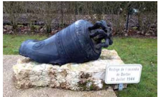
Cloche de Dortan, vestige de l'incendie du 21 juillet 1944.

ler l'épisode dramatique vécu par les habitants de Dortan, lors de la seconde guerre mondiale. Alexis Dubettier, prêtre du village sera malheureusement fusillé par les allemands.