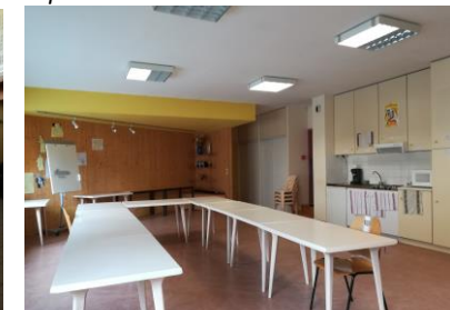
Salle de l'aumônerie