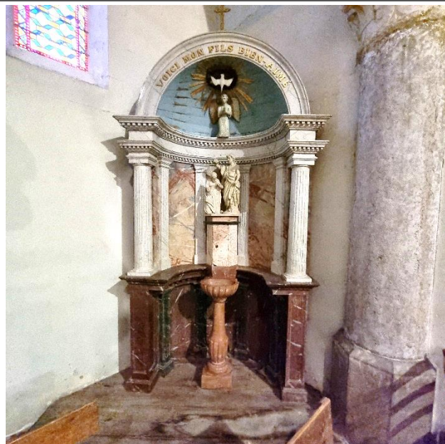
Fonds baptismaux de St Martin le Châtel