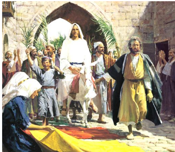
L'entrée de Jésus à Jérusalem

Six jours avant la fête de la Pâque juive [1] Jésus vient à Jérusalem. La foule l'acclame lors de son entrée dans la ville. Elle a tapissé le sol de manteaux et de rameaux verts, formant comme un chemin royal en son honneur.