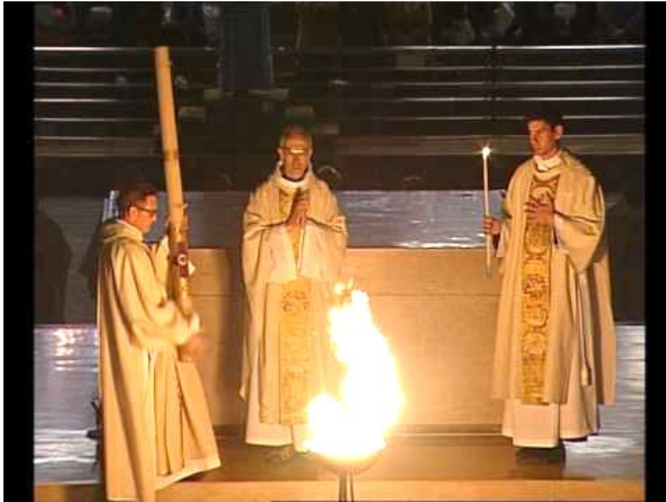
Feu nouveau durant la veillée pascale