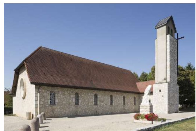
Chapelle Notre-Dame de la route Blanche à Segny