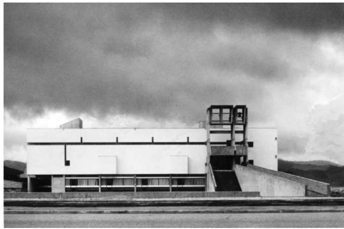
Notre-Dame de la Plaine à Oyonnax