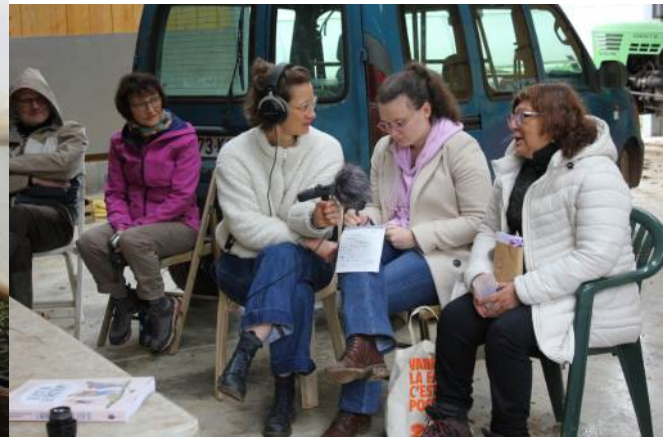
Interview réalisé par Radio B