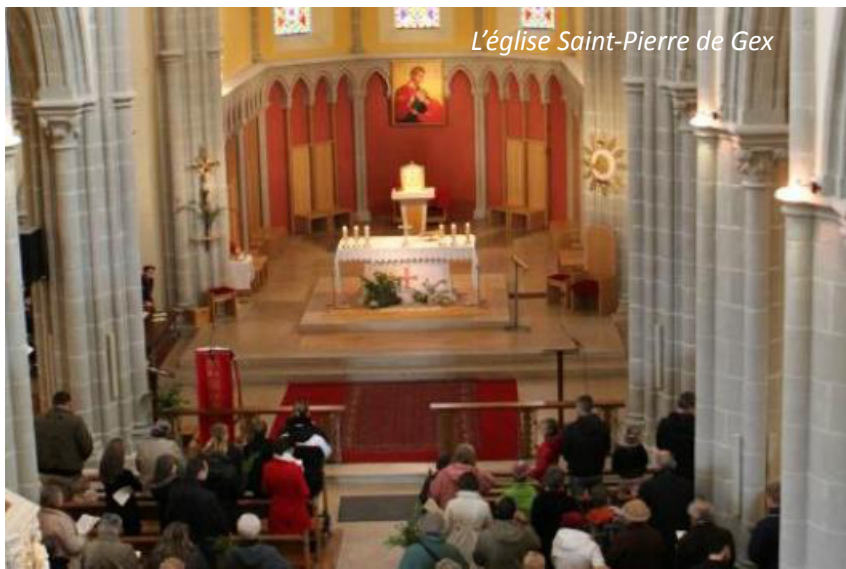
L'église Saint-Pierre de Gex

L'église de Gex a été fermée au culte jusqu'à la messe de réconciliation et de réparation célébrée le jeudi 20 août 2015 à 19 h.