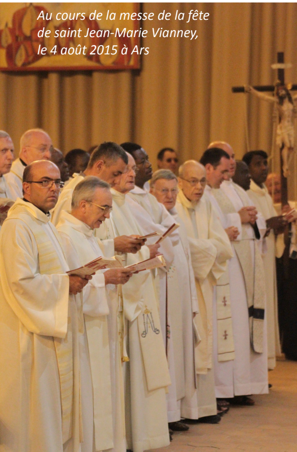
Au cours de la messe de la fête de saint Jean-Marie Vianney, le 4 août 2015 à Ars

Les coordonnées des services et mouvements ayant déménagé au cours de l'été paraîtront dans le prochain numéro d'EPA.