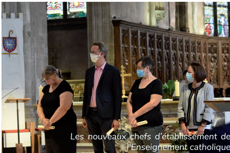
Les nouveaux chefs d'établissement de l'Enseignement catholique

proximité et présence, pour leur permettre d'assumer au mieux leur mission, tant au plan matériel qu'au plan pédagogique, éducatif et spirituel. Soucieux de leur formation, il prêtera particulièrement attention à leur donner de solides repères anthropologiques, pour les aider dans leur mission d'éducation chrétienne.