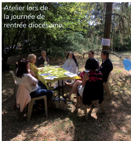
Atelier lors de la journée de rentrée diocésaine.

Aujourd'hui, nous constatons peu de dépôts de bilan supplémentaires par rapport aux autres années, grâce à ces aides. Certaines entreprises manufacturières repartent très fortement, comme l'industrie de la lunette. En revanche, les sous-traitants de l'industrie automobile sont en grande difficulté. Les entreprises du bâtiment ont beaucoup souffert notamment de l'absence de