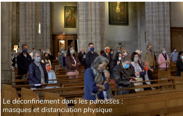
Le déconfinement dans les paroisses : masques et distanciation physique