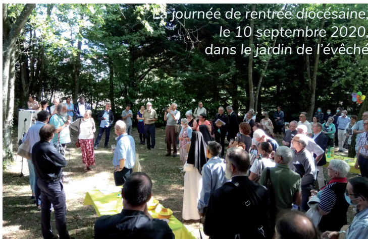
La journée de rentrée diocésaine, le 10 septembre 2020, dans le jardin de l'évêché

les membres du conseil presbytéral. Comme il est trop tard pour l'envisager en 2020, date a été prise pour le 25 septembre 2021.