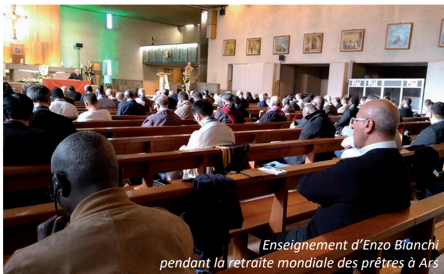
Enseignement d'Enzo Bianchi pendant la retraite mondiale des prêtres à Ars

Notre évêque remarque que, dans la nouvelle Ratio de formation publiée par le Saint Siège, la formation permanente continue est inscrite explicitement : il faut même que la formation initiale soit pensée en fonction de la formation continue. Il constate que nous avons dans le diocèse beaucoup de propositions dans des domaines variés ; mais ceux qui en auraient le plus besoin n'y participent pas. Comment penser une formation personnalisée, comment motiver les prêtres ? Il faut faire des choses plus cohérentes. Sans doute aussi des formations diplômantes. C'est un vaste chantier : Ecriture Sainte, théologie, connaissance du monde, évolution de la société. Il faut peut-être collaborer avec d'autres diocèses, à l'échelle de la Province, en relation avec les attentes et les demandes. Comment s'encourager mutuellement à travailler, en profondeur ?