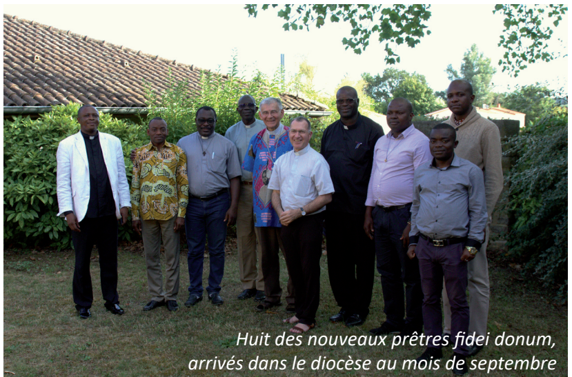
Huit des nouveaux prêtres fidei donum, arrivés dans le diocèse au mois de septembre

Ensuite , nous poursuivrons notre réflexion sur l'accueil et les relations avec les prêtres fidei donum : à partir des réflexions antérieures et des mouvements des derniers mois. Nous présenterons les diverses formations de l'année pastorale (avec leurs importances respectives) et nous réfléchirons à la manière de célébrer les futures ordinations. Nous essayerons d'évaluer l'application des Directives diocésaines sur les intentions et les offrandes de Messe. Nous tenterons aussi une formulation de la vision pastorale diocésaine, laquelle pourra nous aider à bâtir le projet pastoral du 2 e centenaire de notre diocèse (2022-2023). Enfin je vous consulterai sur la mise à jour des Statuts canoniques et civils des Laïcs en Mission Ecclésiale.