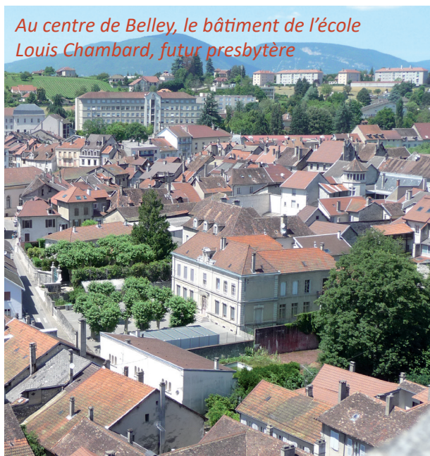
Au centre de Belley, le bâtiment de l'école Louis Chambard, futur presbytère

Avec l'évolution des conditions de vie et de mission des prêtres, les vicaires épiscopaux se retrouvent avec une multitude de casquettes. Le besoin se fait sentir de réformer ce système. Considérant d'une part que le conseil presbytéral, le collège des consultants et le conseil diocésain pour les affaires économiques sont obligatoires, et que, d'autre part, le conseil épiscopal et le conseil diocésain de pastorale