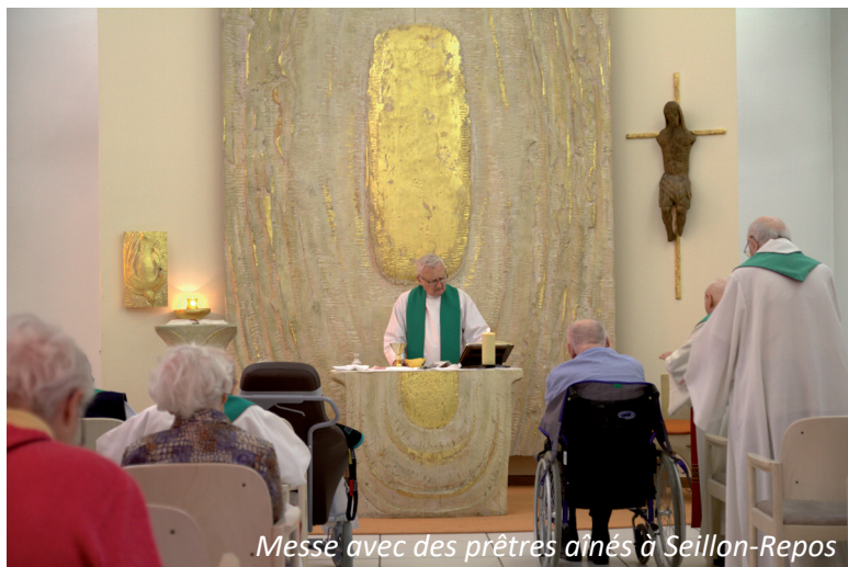
Messe avec des prêtres âgés à Seillon-Repos

tarder en tenir compte dans les projets des assises de l'immobilier. Il n'est pas question de mettre tous les prêtres âgés à la maison de retraite de Seillon Repos, devenu un EHPAD (avec une proportion de 80 à 90 % de personnes dépendantes) ! Il y a actuellement douze prêtres en studio ou en chambre. La convention avec le diocèse devrait passer de 27 studios prioritaires à 9 studios et quelques chambres. Contrairement au bruit que certains font parfois courir, il y a, dans le diocèse, tout un travail de fait pour accompagner les prêtres âgés !