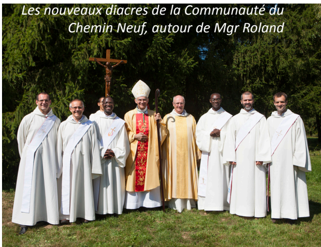
Les nouveaux diacres de la Communauté du Chemin Neuf, autour de Mgr Roland

« Son départ plonge l'aumônerie catholique des prisons dans une tristesse profonde. Avec une énergie constante il a assuré sa fonction