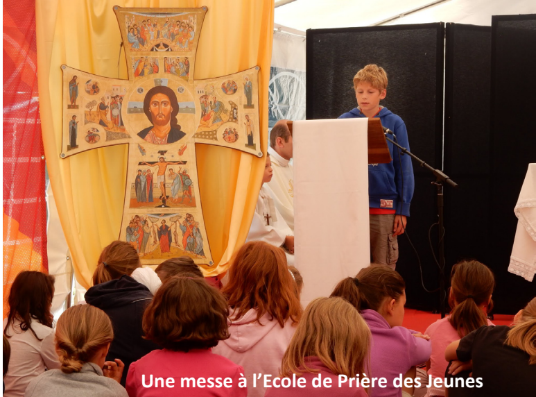
Une messe à l'École de Prière des Jeunes

Avant de les promulguer, notre évêque souhaite que les intéressés puissent les étudier et proposer leurs avis. Pour les prêtres eux-mêmes, l'assemblée des doyens a déjà amendé un projet de grille de relecture de vie sacerdotale ; le nouveau texte est en cours d'expérimentation par quelques volontaires. Un projet de statut financier des prêtres diocésains a été confié récemment aux doyens pour être communiqué aux confrères des doyennés. Pour la vie des paroisses, les prêtres ont déjà reçu un projet d'introduction au futur vade mecum des sacrements et un projet d'orientations pastorales sur les funérailles. Par l'intermédiaire des doyens, les prêtres vont bientôt recevoir plusieurs autres textes