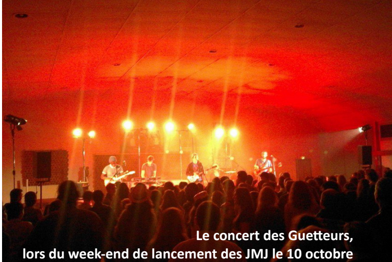
Le concert des Guetteurs, lors du week-end de lancement des JMJ le 10 octobre

La fête diocésaine de la famille , le dimanche 26 juin 2016, à l'Abbaye Notre-Dame des Dombes, sera aussi un temps fort diocésain de cette année sainte. La commission de préparation dirigée par le P. Frédéric Pelletier est à l'œuvre pour prévoir le programme de cette journée.