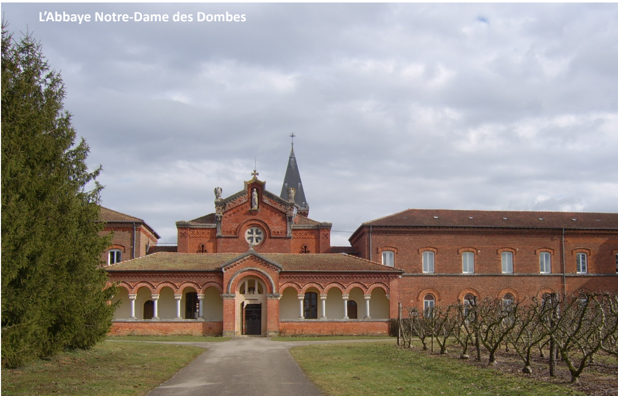
L'Abbaye Notre-Dame des Dombes

En juin 2013, notre évêque a promulgué les nouveaux statuts du conseil presbytéral et le regroupement des doyennés et des