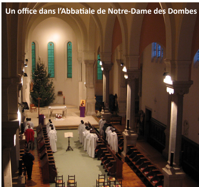
Un office dans l'Abbatiale de Notre-Dame des Dombes

Merci à la communauté pour son accueil fraternel.