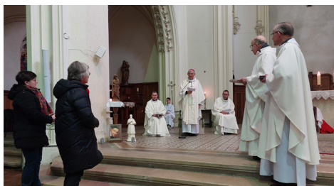
Remise des médailles du mérite diocésain