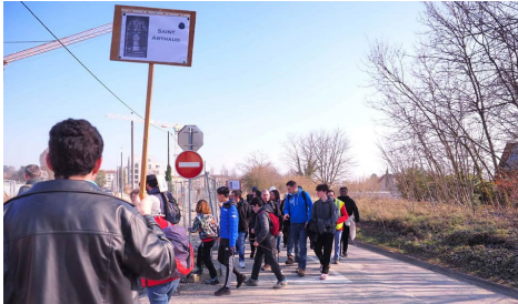
Marche en chapîtres