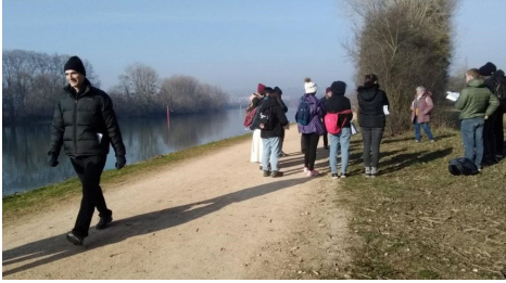
Samedi 11 février 2023 Départ de la marche de la marche des vocations de Saint Bernard