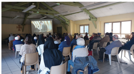
Documentaire Le Chemin du Ciel