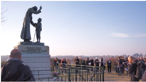
Arrivée de la marche à Ars et prière au monument de la Rencontre