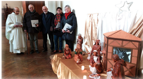
L'équipe Foi et Pratiques artistiques devant la crèche diocésaine exposée dans la chapelle S t Joseph