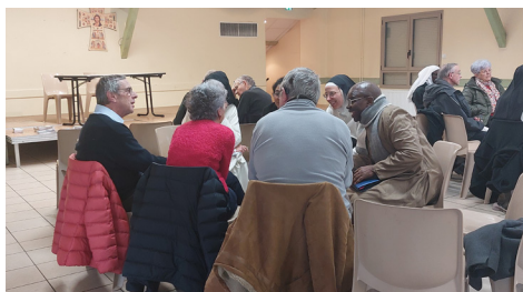
Echange sur la Vie Consacrée