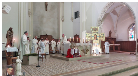
Messe célébrée à la chapelle Saint Joseph

C'est le 2 février, journée mondiale de la vie consacrée, qui a été retenu pour vivre ce temps fort et faire découvrir la beauté de la vie consacrée dans le diocèse