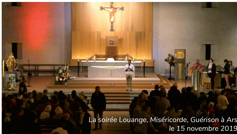
La soirée Louange, Miséricorde, Guérison à Ars le 15 novembre 2019