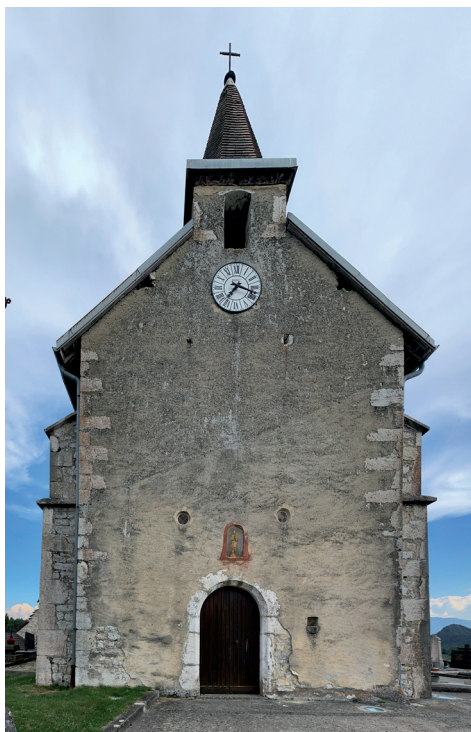
L'église Saint-Maurice de Chatonod