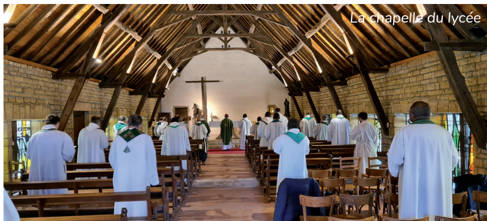
La chapelle du lycée

Si notre époque prend conscience de l'urgence écologique, ici à Ressins, on la vit dans la transmission du prendre soin de la « maison commune », de la création, particulièrement dans l'agriculture ! On devine que bien des jeunes, ici, on prit leur envol en apprenant un savoir-faire et surtout un savoir être afin non pas de réussir dans la vie mais réussir sa vie !