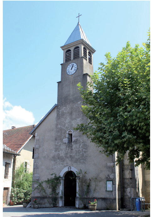
L'église Saint-Martin de Saint-Champ

Article 3. §1. Suite à cette décision, le groupement paroissial de Belley est désormais composé de la paroisse de Belley et des paroisses suivantes réparties par secteur :