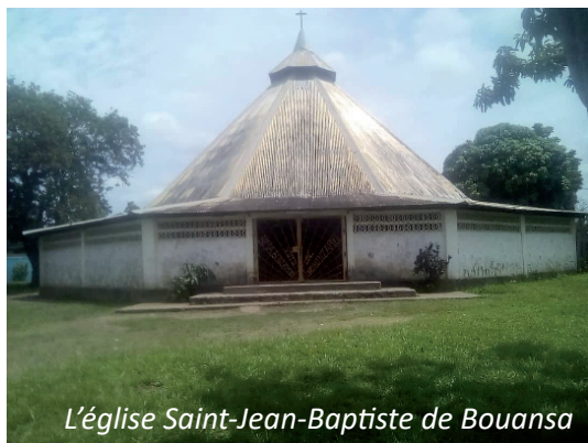
L'église Saint-Jean-Baptiste de Bouansa