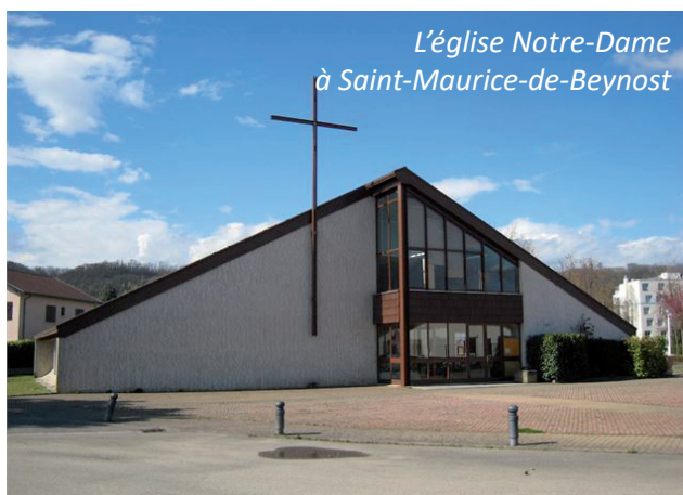
L'église Notre-Dame à Saint-Maurice-de-Beynost

On arrive ainsi à une prévision globale de 1 156 k€ pour l'année 2019.