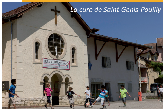
La cure de Saint-Genis-Pouilly