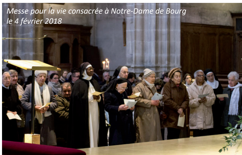
Messe pour la vie consacrée à Notre-Dame de Bourg le 4 février 2018