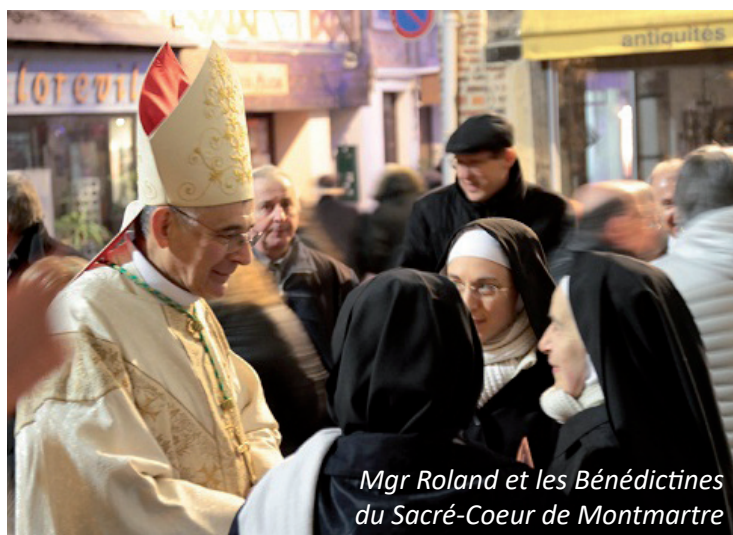
Mgr Roland et les Bénédictines du Sacré-Coeur de Montmartre