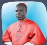
+ Cardinal BIAYENDA en voie de béatification surnommé le Curé d'Ars africain