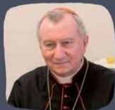
Présidée par le Cardinal Pietro PAROLIN Secrétaire d'Etat du Vatican