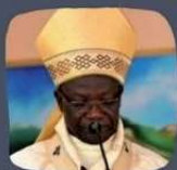
Mgr MILANDOU Archevêque de Brazzaville