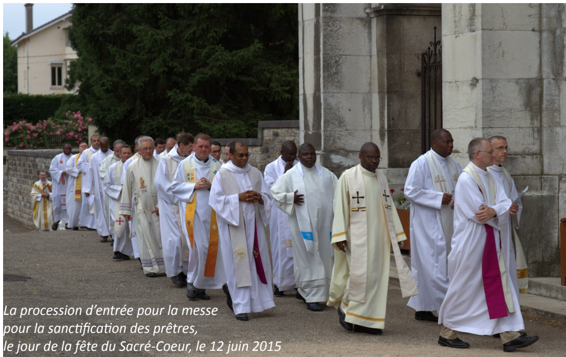
La procession d'entrée pour la messe pour la sanctification des prêtres, le jour de la fête du Sacré-Coeur, le 12 juin 2015