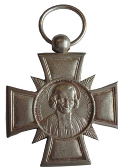
La médaille du Mérite diocésain, de 1930 à 2010

Actuellement, la plupart des diocèses français ont conservé cette pratique, même si une tendance est à l'adoption d'une médaille de table pour remplacer les médailles portables. Belley-Ars a choisi cette formule en 2010. Depuis c'est une vingtaine de fidèles de ce diocèse qui l'ont reçue après de nombreuses années de bénévolat humble et discret : parfois 70 ans de service fidèle !