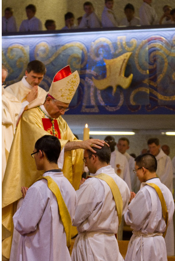
Mgr Roland impose les mains à l'abbé Baudouin d'Orléans

Ministres du sacrement du pardon, les prêtres doivent être « un véritable signe de la miséricorde du Père ». « Chaque confesseur doit accueillir les fidèles comme le père de la parabole du fils prodigue : un père qui court à la rencontre du fils, bien qu'il ait dissipé tous ses biens. Les confesseurs sont appelés à serrer sur eux ce fils repentant qui revient à la maison, et à exprimer la joie de l'avoir retrouvé. Ils ne se laisseront pas non plus d'aller vers l'autre fils resté dehors et incapable de se réjouir, pour lui faire comprendre que son jugement est sévère et injuste, et n'a pas de sens face à la miséricorde du Père qui n'a pas de limite » (n° 17).