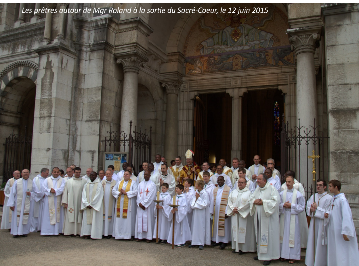
Les prêtres autour de Mgr Roland à la sortie du Sacré-Coeur, le 12 juin 2015