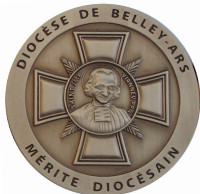
La nouvelle médaille du Mérite diocésain, depuis 2010