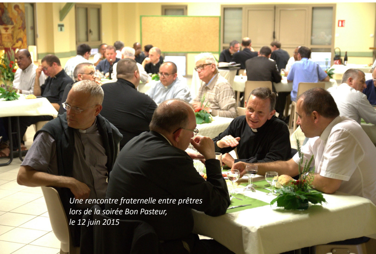
Une rencontre fraternelle entre prêtres lors de la soirée Bon Pasteur, le 12 juin 2015

Ces statuts, élaborés en 1992 et complétés en 1997, devaient servir de modèle à la rédaction de statuts propres à chaque groupement de paroisses. Dans la pratique, il y a eu peu de rédactions particulières. Les paroisses se sont servi directement du texte de 1997. Pour tenir compte de cette réalité, il est demandé