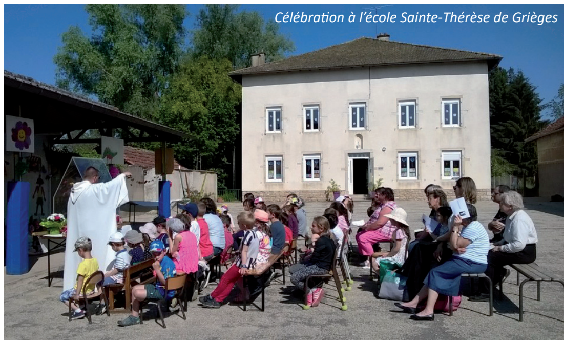
Célébration à l'école Sainte-Thérèse de Grièges

Dans certaines institutions la collaboration du prêtre s'avère problématique : le prêtre s'estime considéré comme un « prestataire de service » sans véritable autorité pastorale, notamment dans le choix des APS ou des parcours de catéchèse pour lesquels il n'est pas toujours consulté ! Le texte de la fiche 11 ne permet guère de remédier à ce type de situation. Dans d'autres institutions, les prêtres ont leur place dans l'établissement et il y a une bonne articulation avec les responsables éducatifs. La personnalité des uns et des autres peut jouer, mais il conviendrait d'avoir un texte clair précisant mieux le rôle de chacun en cohérence avec les articles 145 et 220 du Statut de l'enseignement catholique sur les responsabilités respectives des chefs d'établissement et des prêtres, mais aussi avec le can. 150 du Code de droit canonique qui requiert le caractère sacerdotal pour tout « office comportant pleine charge d'âmes ».