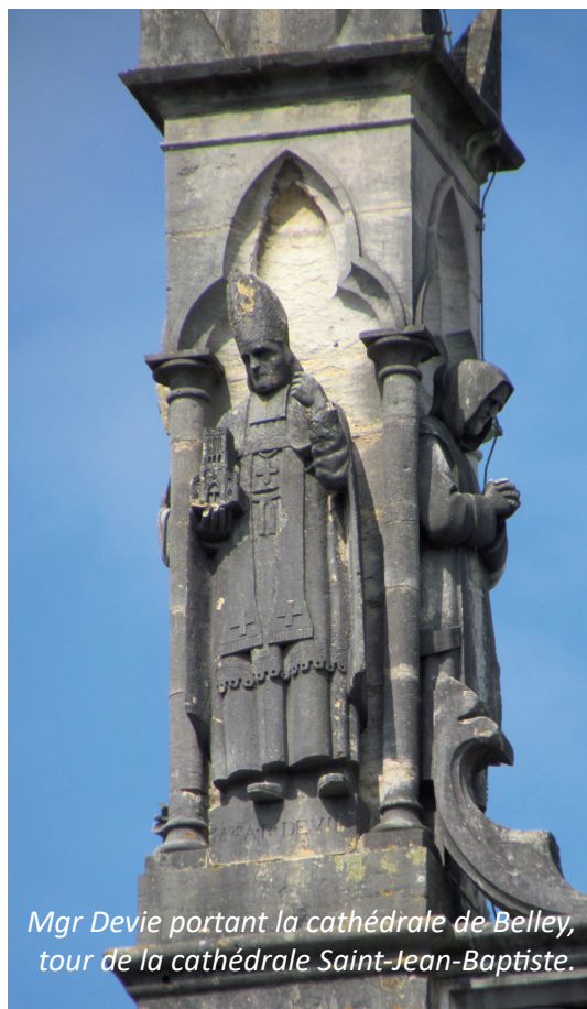
Mgr Devie portant la cathédrale de Belley, tour de la cathédrale Saint-Jean-Baptiste.