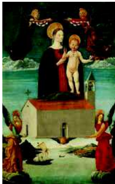
Illustration : la Translation de la Sainte Maison de Lorette, attribué à Saturnino Gatti, Metropolitan Museum, env. 1510

Les textes liturgiques en latin pour la célébration de l'eucharistie et la liturgie des heures ont été publiés. Vous trouverez ci-contre l'oraison (qui correspond à la seconde prière de la messe en l'honneur de Marie, Fille de Sion) et les références des lectures pour la messe. Quant à l'office des lectures, sa traduction sera publiée dès qu'elle aura été approuvée.