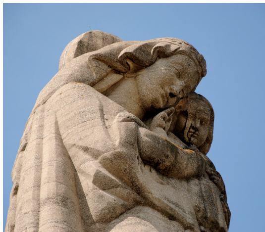
Notre-Dame du Mas-Rillier, à Miribel

Visite pastorale à Miribel (programme p. 6)