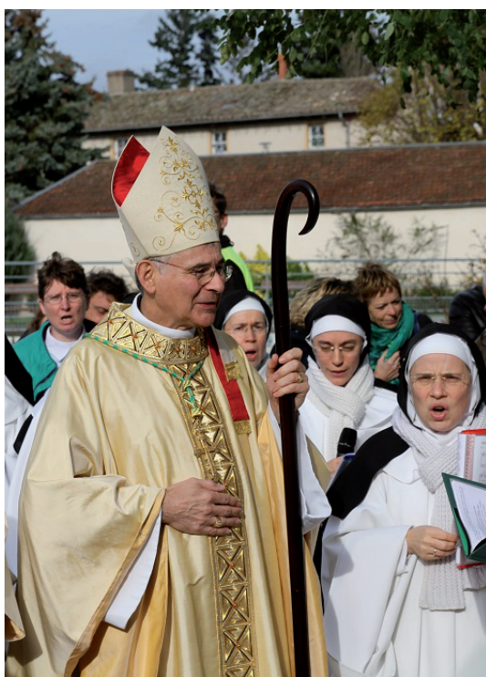
Illustration : Mgr Pascal Roland devant la Basilique d'Ars, le 20 novembre 2016, pour la clôture du Jubilé extraordinaire de la Miséricorde