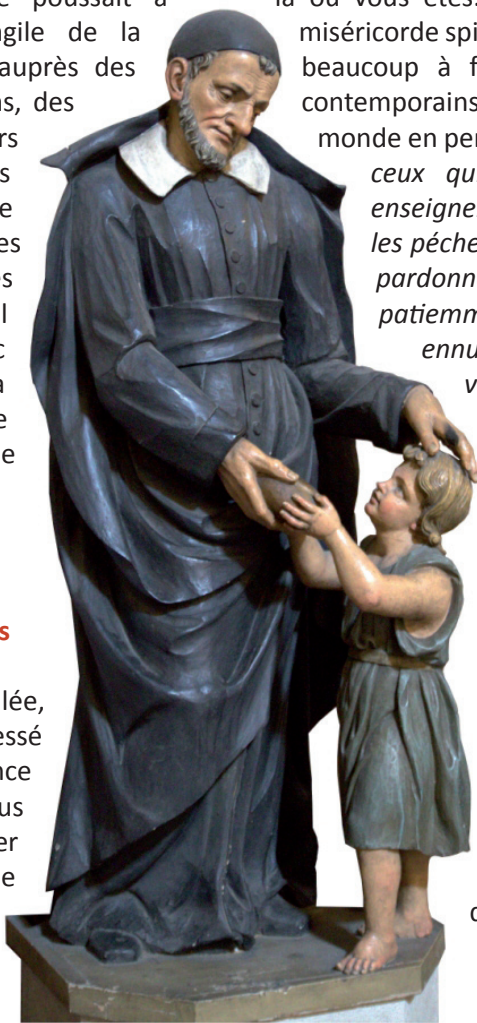
Saint Vincent de Paul curé de Châtillon patron des œuvres de charité

Dans ce monde qui connaît des changements en profondeur, croire en Jésus-Christ ne va plus de soi et nous réalisons qu'être chrétien est un choix personnel, d'autant plus exigeant que le milieu ambiant n'est généralement pas porteur. Autrefois nos ancêtres ont traversé les mers pour aller évangéliser des terres lointaines. Aujourd'hui