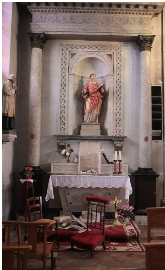
Le tabernacle détruit de l'église de Saint-Etienne-du-Bois

• Profanations de l'Eucharistie. Ces dernières semaines, le diocèse a été bouleversé par une série de profanations selon un scénario identique visant explicitement le Saint Sacrement. Les gendarmes ont pris ces affaires au sérieux. Il convient aussi d'être plus vigilant pour sécuriser les tabernacles. A ce sujet l'évêque a demandé la rédaction d'une note pastorale et son envoi à tous les curés, chapelains et chefs d'établissements d'enseignement disposant d'une chapelle avec le Saint Sacrement. Il fait remarquer que ces événements ont eu quelques effets positifs : ils ont suscité une belle mobilisation qui a été l'occasion d'une évangélisation sur le mystère de l'Eucharistie et sur l'importance de la conversion.