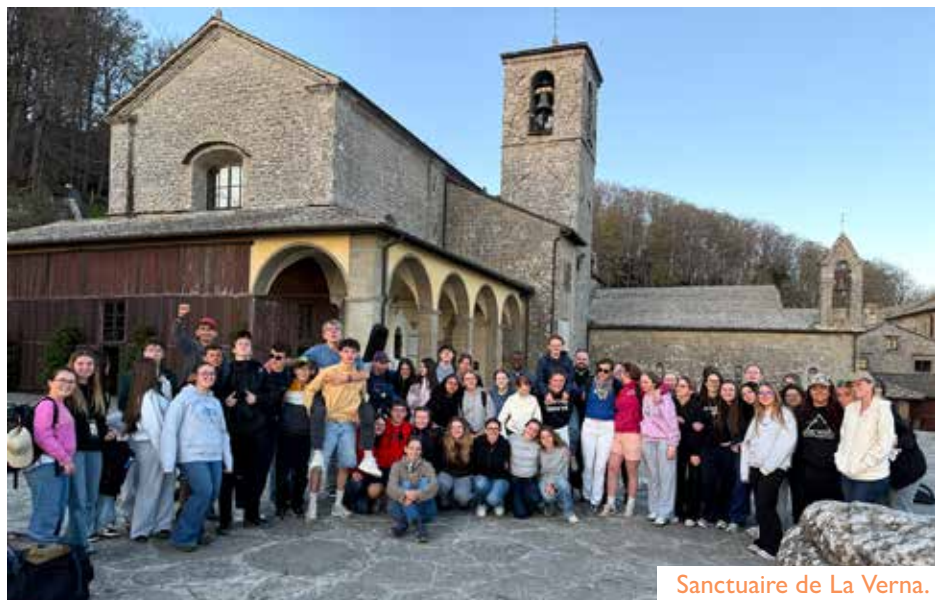
Sanctuaire de La Verna.