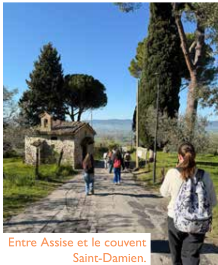
Entre Assise et le couvent Saint-Damien.

Merci à tous les jeunes et accompagnateurs pour ce pèlerinage qui aura permis à chacun de grandir!