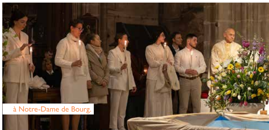
à Notre-Dame de Bourg.