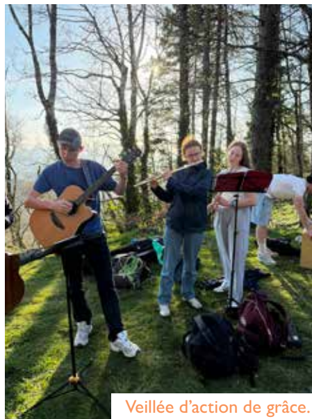
Veillée d'action de grâce.