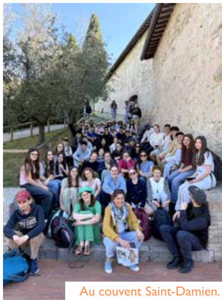
Au couvent Saint-Damien.