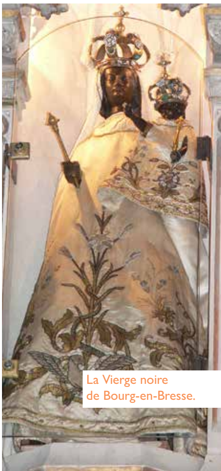
La Vierge noire de Bourg-en-Bresse.

Le Rosaire est structuré autour des mystères de la vie du Christ: mystères joyeux, lumineux, douloureux et glorieux. Il permet de parcourir les grands événements de l'Évangile, depuis l'Annonciation jusqu'à la Résurrection et la gloire du Royaume. Le Directoire romain le qualifie de prière