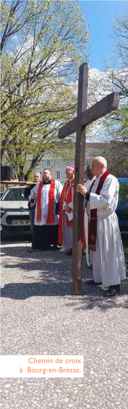
Chemin de croix à Bourg-en-Bresse.

en marche vers notre patrie du ciel. En recentrant notre regard sur le Verbe de Dieu qui s'est fait homme, ce jubilé nous a providentiellement entraînés dans un mouvement de descente et de dépouillement, qui non seulement nous rapproche véritablement du Fils de Dieu, dont nous prétendons être les disciples; mais qui nous rend également plus proches des personnes fragiles, de tous les plus petits auxquels le Fils de Dieu s'est identifié, et auxquels nous sommes envoyés en priorité: celui qui a faim et soif, celui qui est étranger, sans toit, celui qui est malade ou en prison (Mt 25, 37-40).