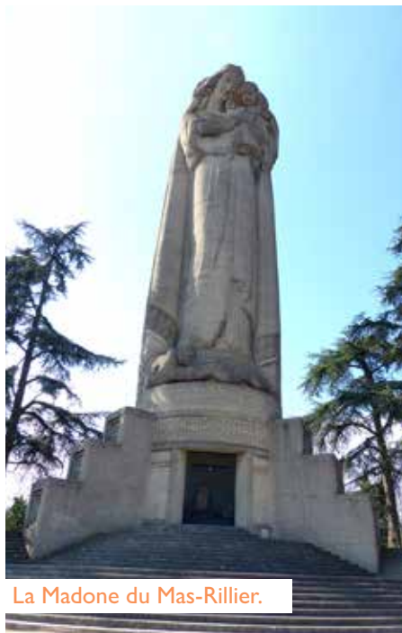
La Madone du Mas-Rillier.

bibliquement inspirée, centrée sur la contemplation des événements salvifiques de la vie du Christ et sur leur lien avec la Vierge Marie. Il ajoute que le Rosaire est essentiellement une prière contemplative, qui demande un rythme paisible et une méditation réelle des mystères du Seigneur.