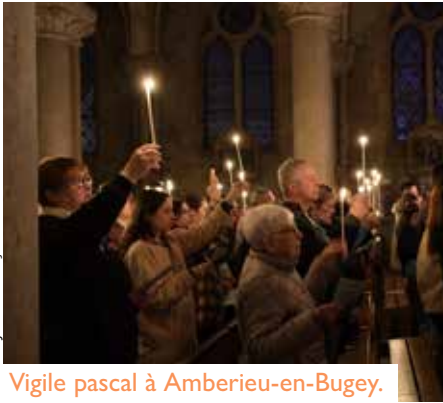
Vigile pascal à Amberieu-en-Bugey.

tombante, symbole de la vie sans Dieu; symbole du péché et de la mort. Nous avons alors accueilli le Christ, en qui nous avons reconnu notre Lumière. Nous avons acclamé celui qui remporte la victoire sur les ténèbres. Et puis nous l'avons librement suivi, avec confiance, tous ensemble, manifestant par là notre détermination à vivre en enfants de Lumière. Le Christ ressuscité nous a alors communiqué sa lumière. Nous en avons tous été progressivement illuminés; et nous sommes devenus un peuple rayonnant de la lumière divine. Vous aussi, dans quelques instants, vous recevrez cette lumière en partage.