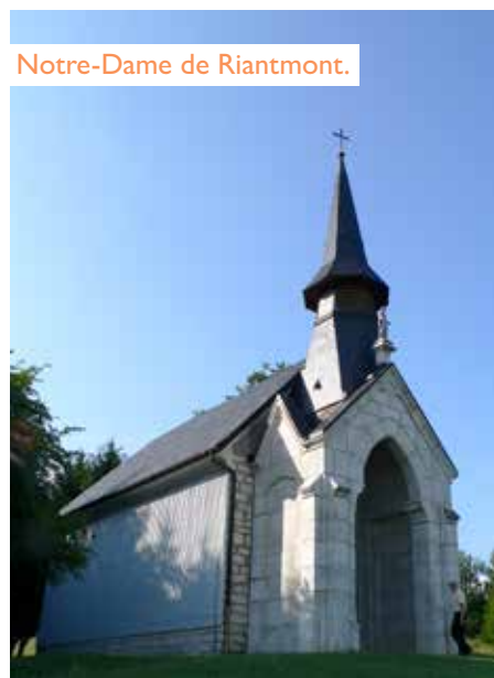
Notre-Dame de Riantmont.

Dans le Pays de Gex, la piété mariale trouve une expression forte avec la chapelle Notre-Dame de Riantmont , à Ve-