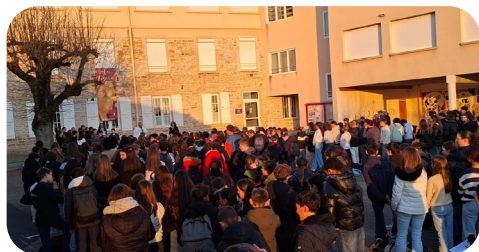
Hommage de l'école Saint Vincent à Ferney-Voltaire