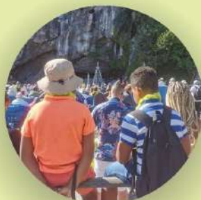
Pastorale des familles