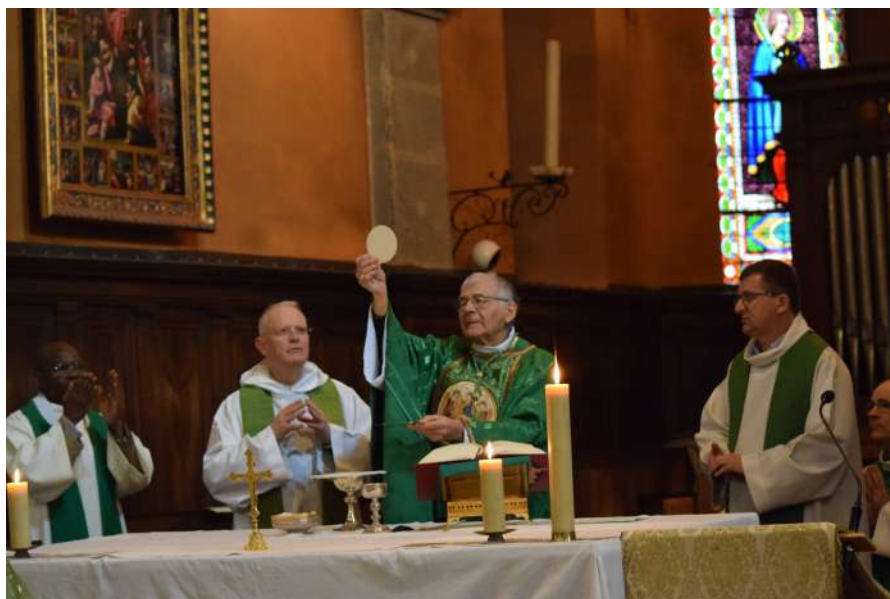
Dimanche 21 janvier - Appel décisif à Saint Rambert en Bugey

Retraite sacerdotale diocésaine à Sancey